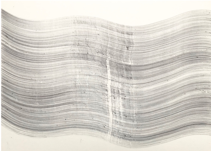
Hauch, 30 x42 cm, Kugelschreiber auf Fotokarton, 2019