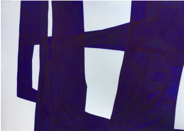
Form N° 72, 15,7 x 21,5 cm, Kugelschreiber auf Fotokarton, 2018

Im Gegensatz zu den Zeichnungen „Hauch“, in denen der Verzicht auf Formgebung im Vordergrund steht, tritt in den Zeichnungen „Form“ eine Eigenwilligkeit und Selbstpräsenz der Gestaltung hervor.